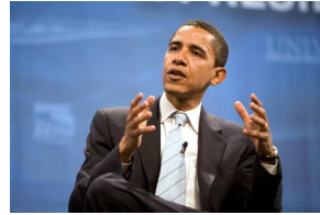
Barack Obama

Fünf Jahre nach der Ankündigung einer Welt ohne Atomwaffen durch US-Präsident Barack Obama haben die USA damit begonnen, die in Deutschland stationierten Atombomben zu modernisieren. Die Bundesregierung bestätigte nach Informationen der in Düsseldorf erscheinenden "Rheinischen Post" (Dienstausgabe) in der Antwort auf eine Anfrage der Grünen ein entsprechendes "Lebensdauerverlängerungsprogramm der US-amerikanischen Atombomben", über das es mit der Bundesregierung "keine Verhandlungen" gegeben habe. »